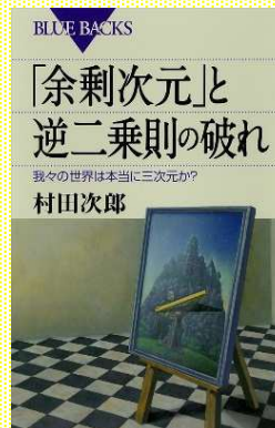
『「余剰次元」と逆二乗則の破れ 我々の世界は本当に三次元か?』 村田 次郎/著 講談社