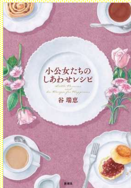
『小公女たちのしあわせレシピ』 谷 瑞恵/著 新潮社