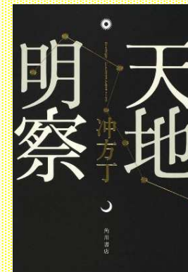
『天地明察』 沖方 丁/著 角川書店