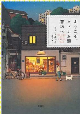
『ようこそ、ヒュナム洞書店へ』 ファン・ボルクム/著、牧野美加/訳 集英社