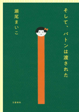
『そして、バトンは渡された』 瀬尾 まいこ/著 文藝春秋