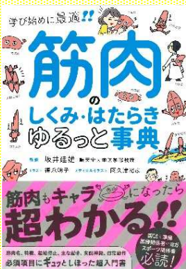
『筋肉のしくみ・はたらきゆるっと事典』 坂井 建雄/監修 永岡書店