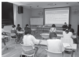
ブックトークはじめま専科の様子

これからも、ブックトークの実践者の裾野を広げて、愛媛の子どもたちと本との出会いを応援していきます。