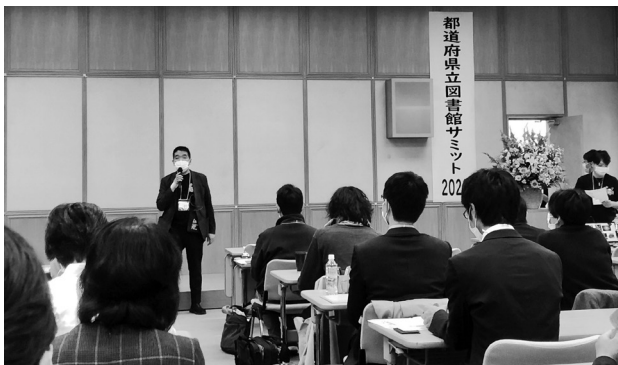
都道府県立図書館サミットの様子