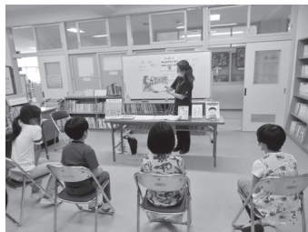
小学校でのブックトーク実践の様子

県立図書館が子どもの読書活動推進事業の要として進めてきたブックトーク事業ですが、令和5年度で18年目となりました。当初は司書1名で実施していましたが、今では読書振興グループ4名で年間10校において開催しています。