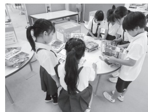
「まなぼん」を利用する児童

本はそのものにも価値はありますが、読まれてこそ真価を発揮するものです。コロナ禍を経て学校生活が通常に戻りつつあるなかで、さらにプログラミング教育が導入されたり情報が必修科目となったりしています。ますます多忙を極める教育現場ですが、子どもと本との出会いの場をぜひ作っていただき、読むことの楽しさを味わってほしいと思います。